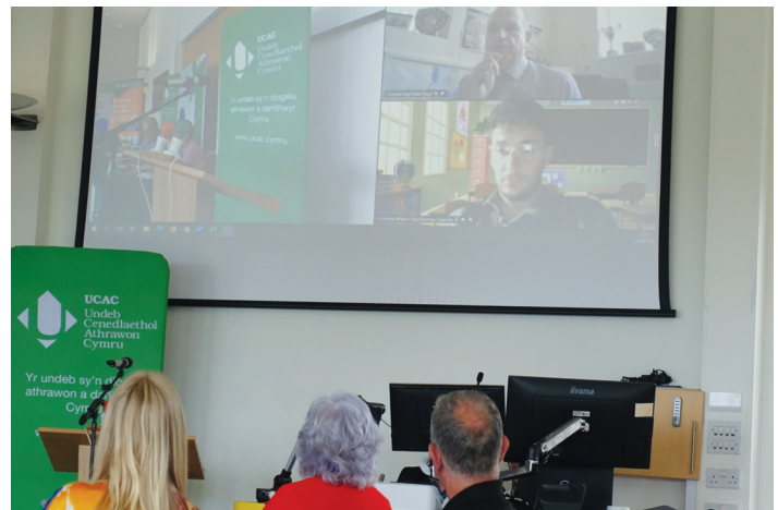
Cynhadleddwyr yn ymuno o bell

Derbyniwyd yn unfrydol yng nghyfarfod y Cyngor Cenedlaethol ar 6-7-22